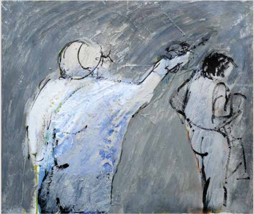
55x46 cm, 1996