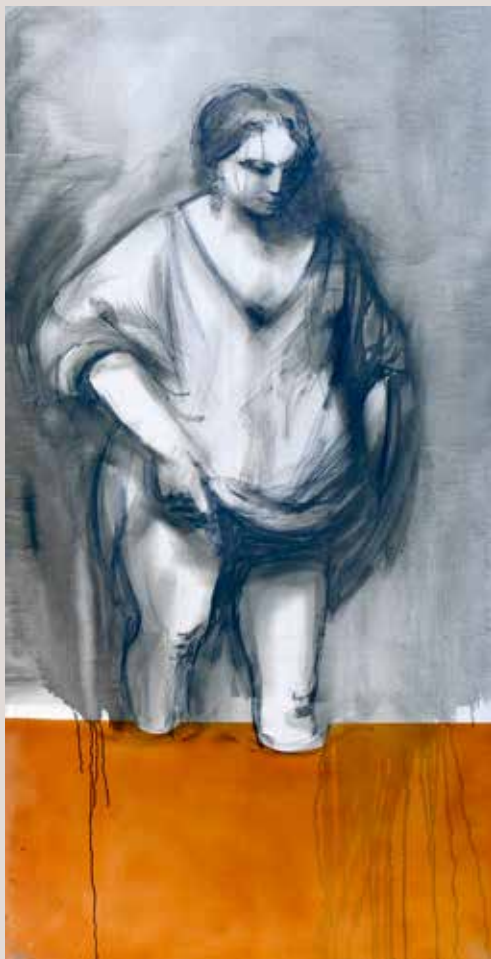
200x100 cm, 2001