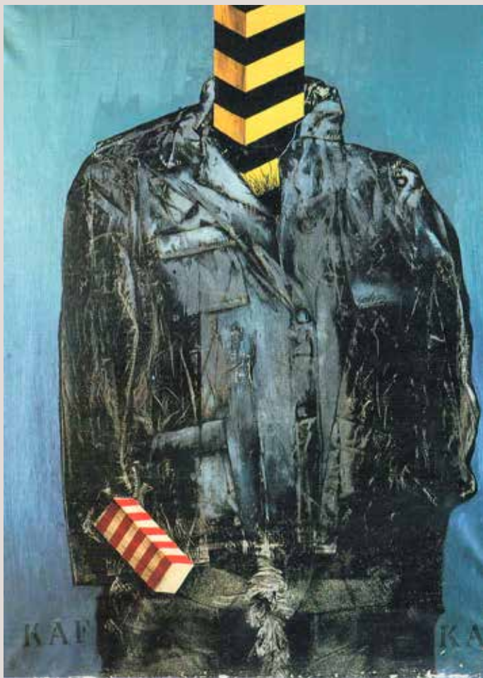
160x90 cm, 1975