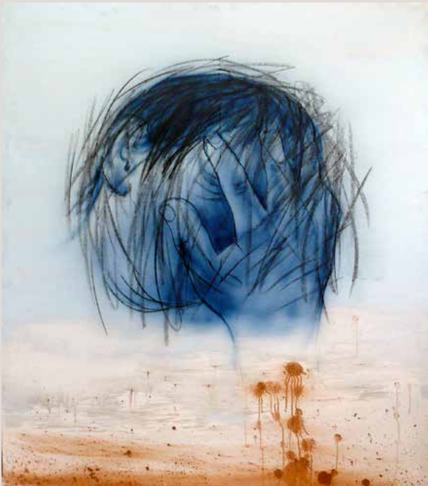
135x116 cm, 2017