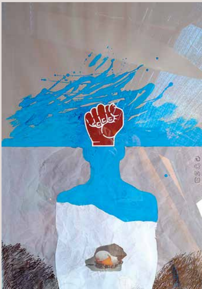
65x50 cm, 2008