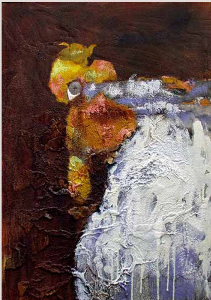
100x81 cm, 1989