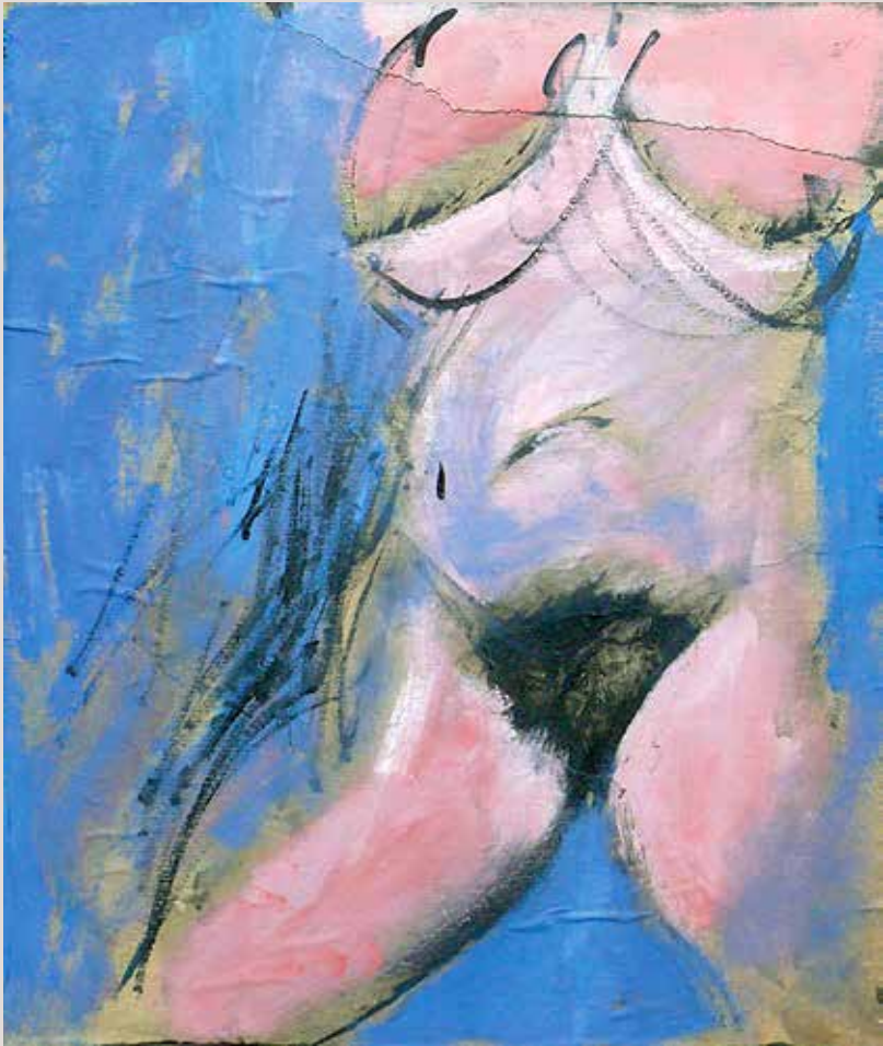
55x46 cm, 1991