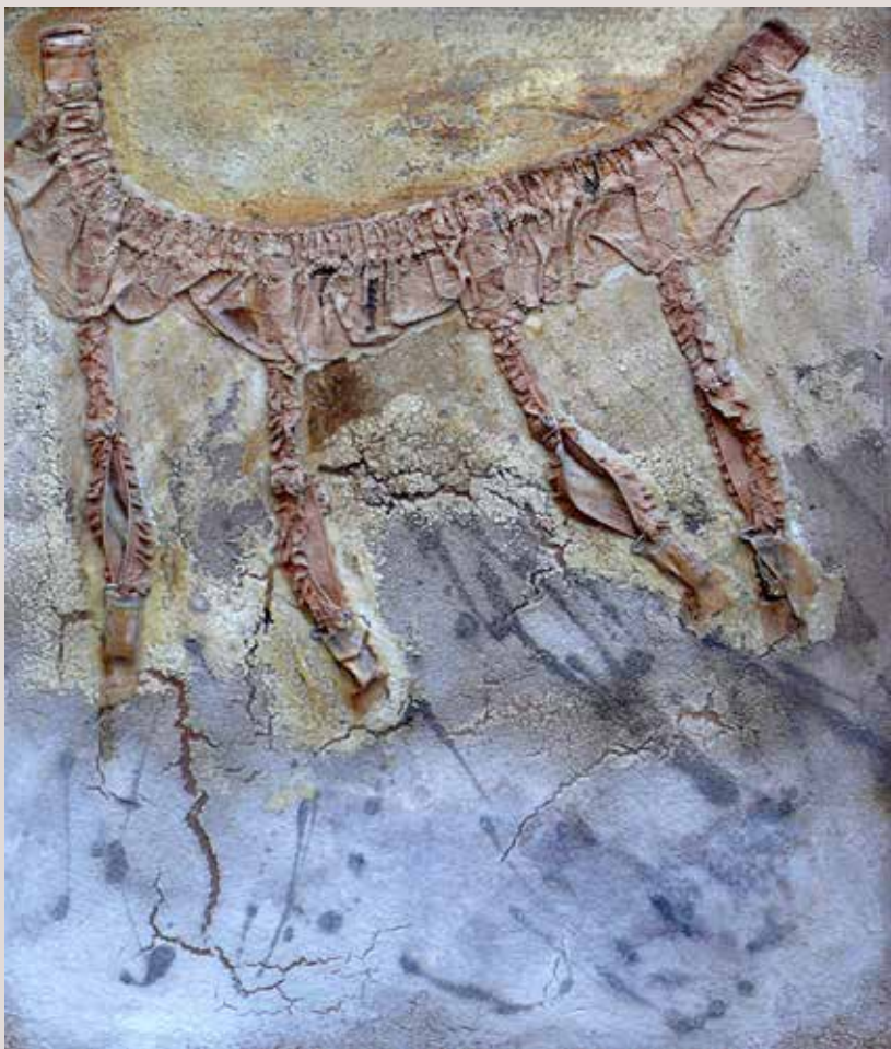
55x48 cm, 1996