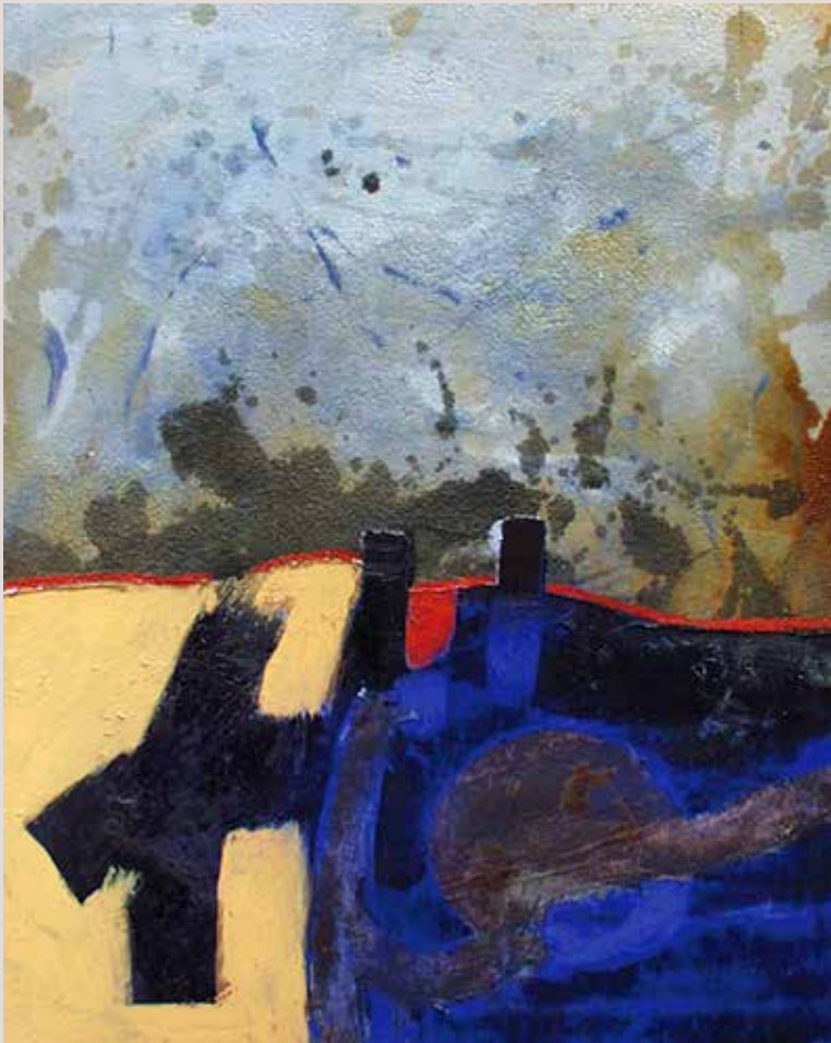
100x90 cm, 1999