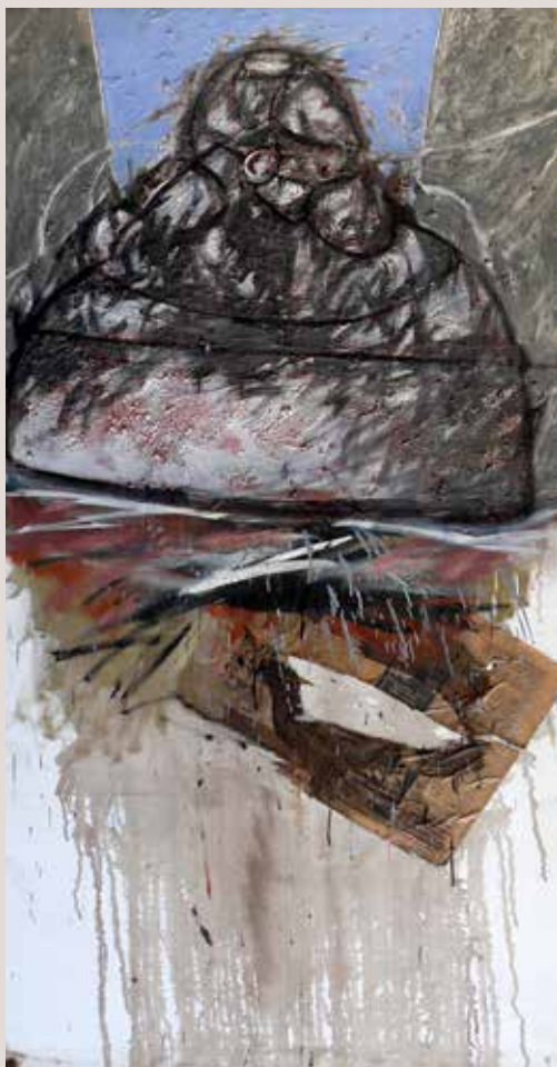
200x100 cm, 2001