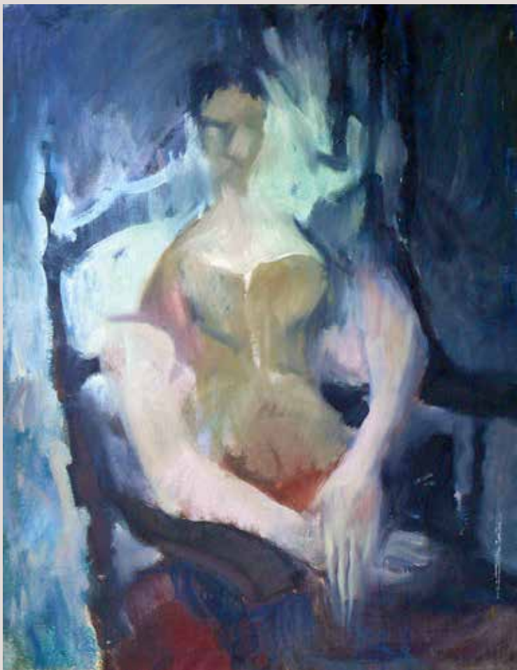
116x89 cm, 1969