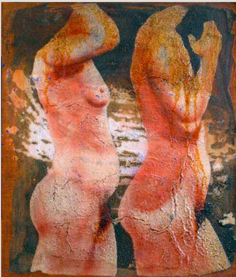
65x54 cm, 1996