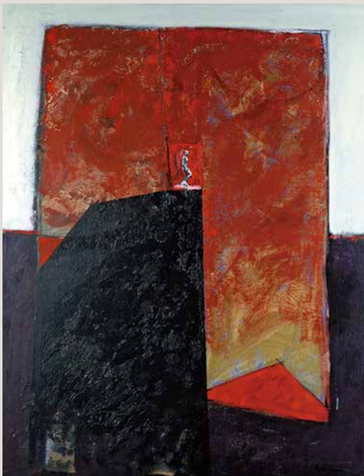
100x81 cm, 1989